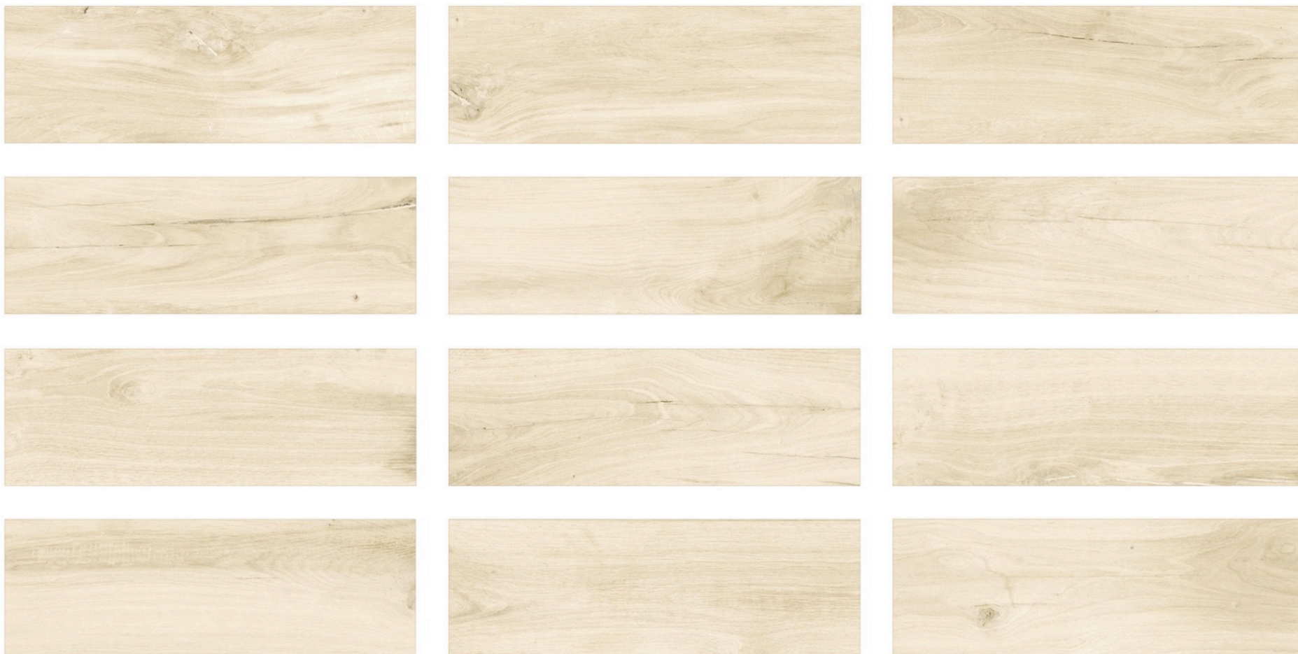
RANCHO jasny beż – RAN 02 natura 20x60