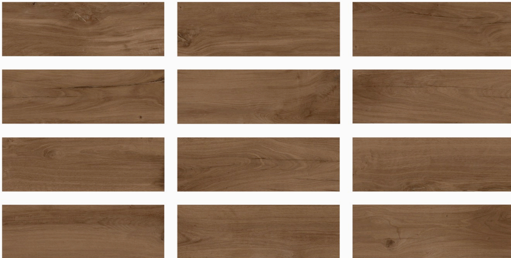
RANCHO ciemny brąz – RAN 05 natura 20x60