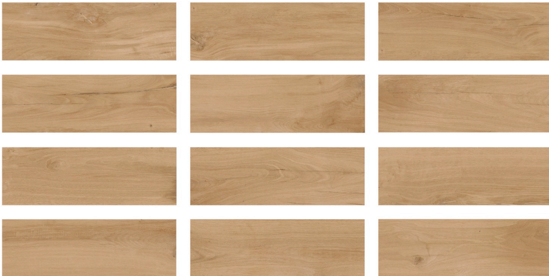
RANCHO ciemny beż – RAN 03 natura 20x60